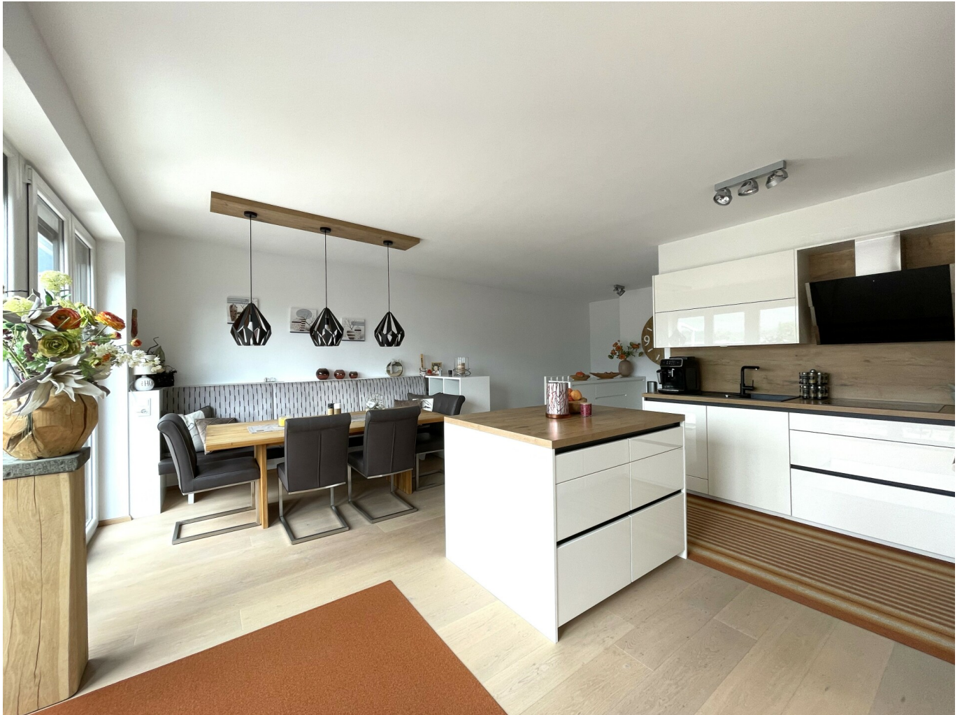
Dachgeschoss: Küche / Essbereich