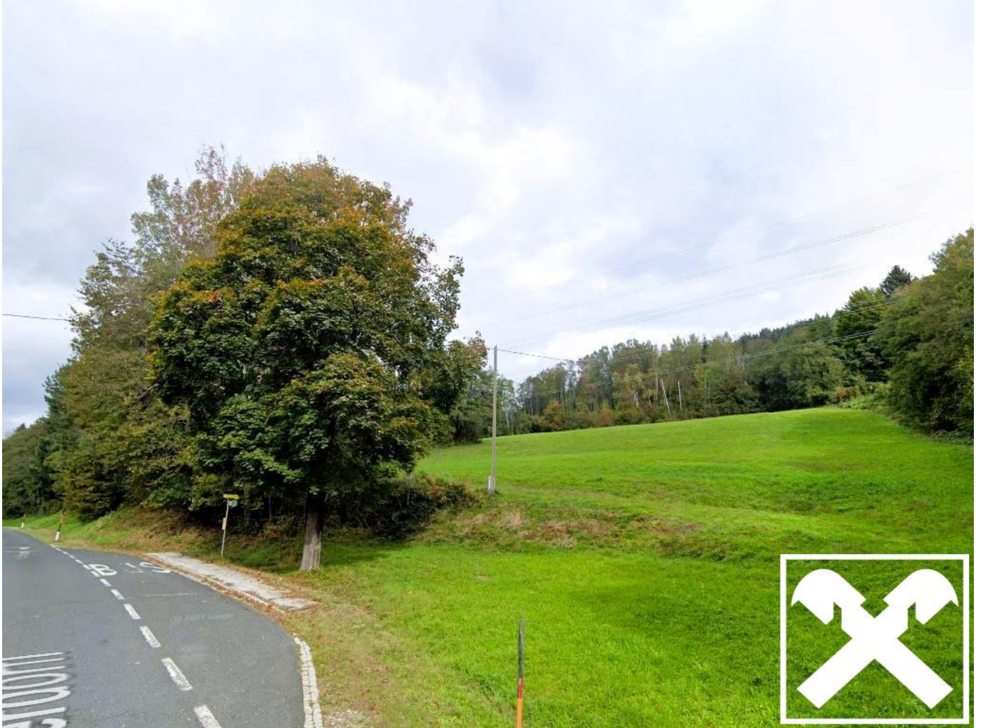
Zufahrt von der Landesstraße