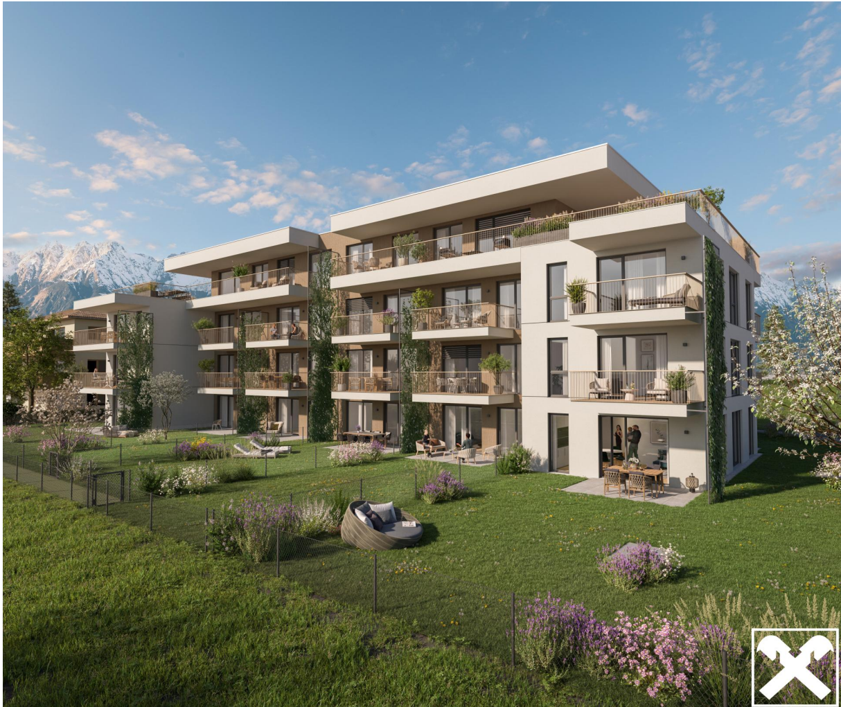
Visualisierung Algunder Straße Front