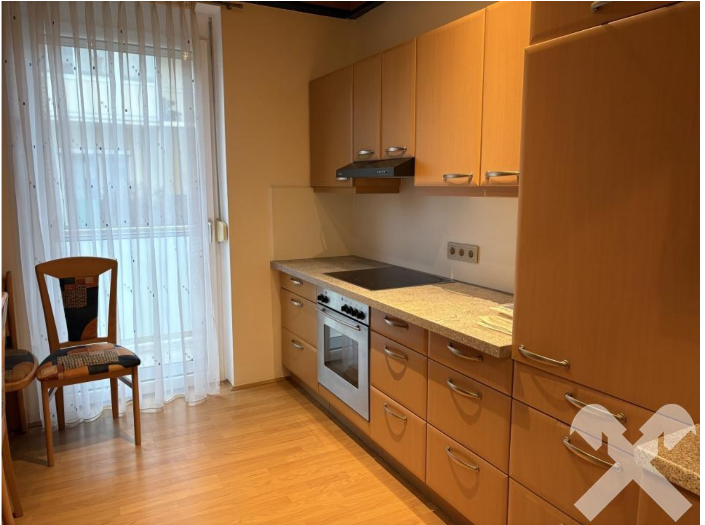
Küche mit Balkonzugang