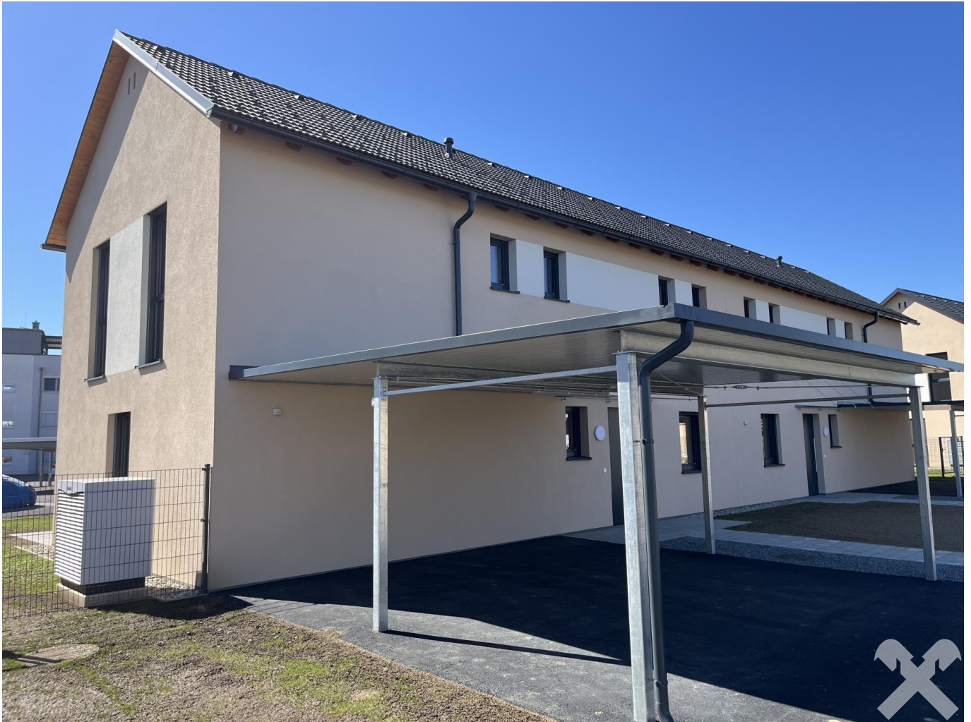
Vorderansicht DHH mit Carport