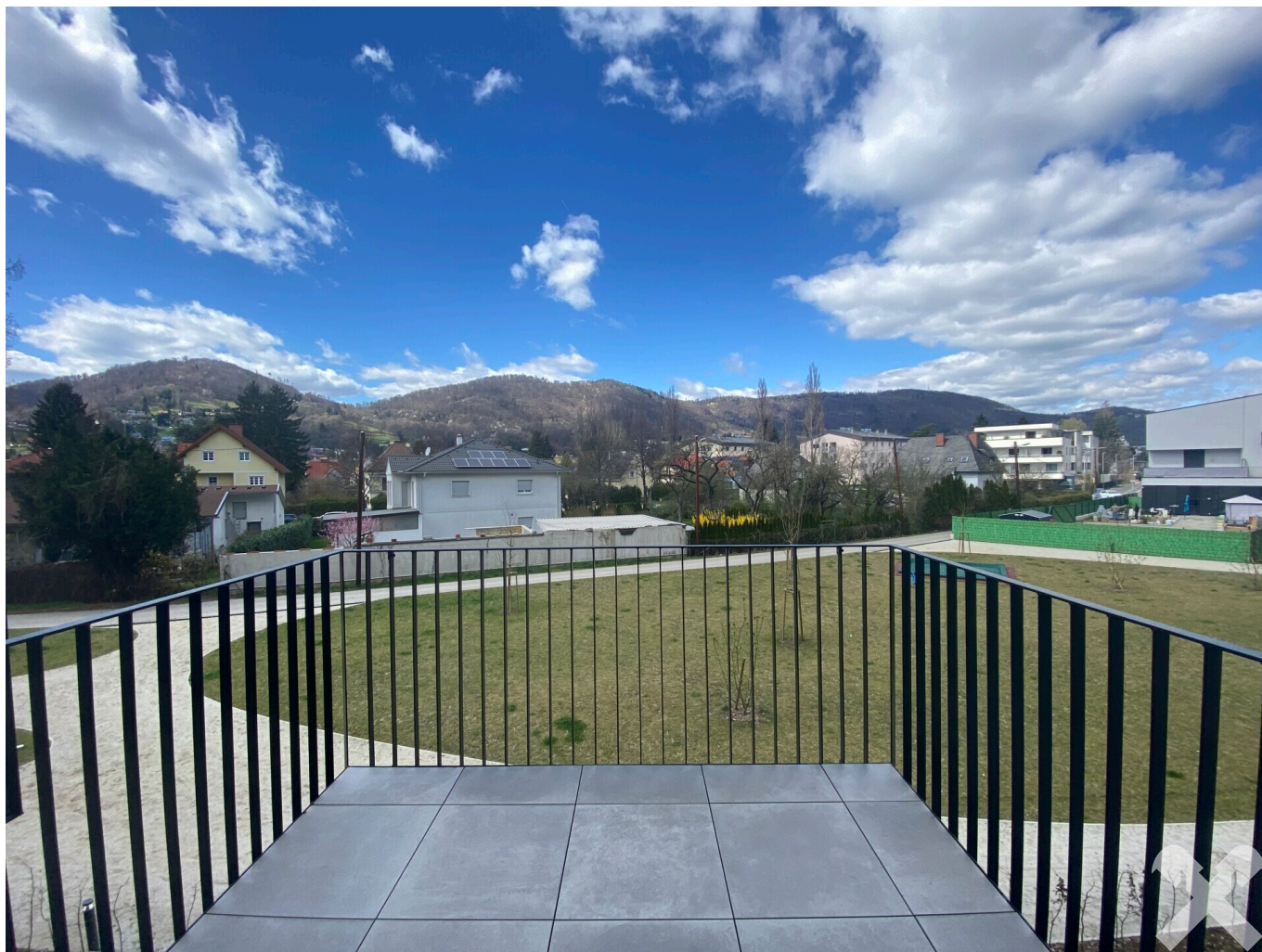
Zimmer - Küche - Balkon