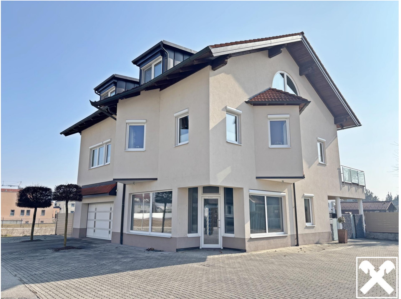
Wohn- und Geschäftshaus