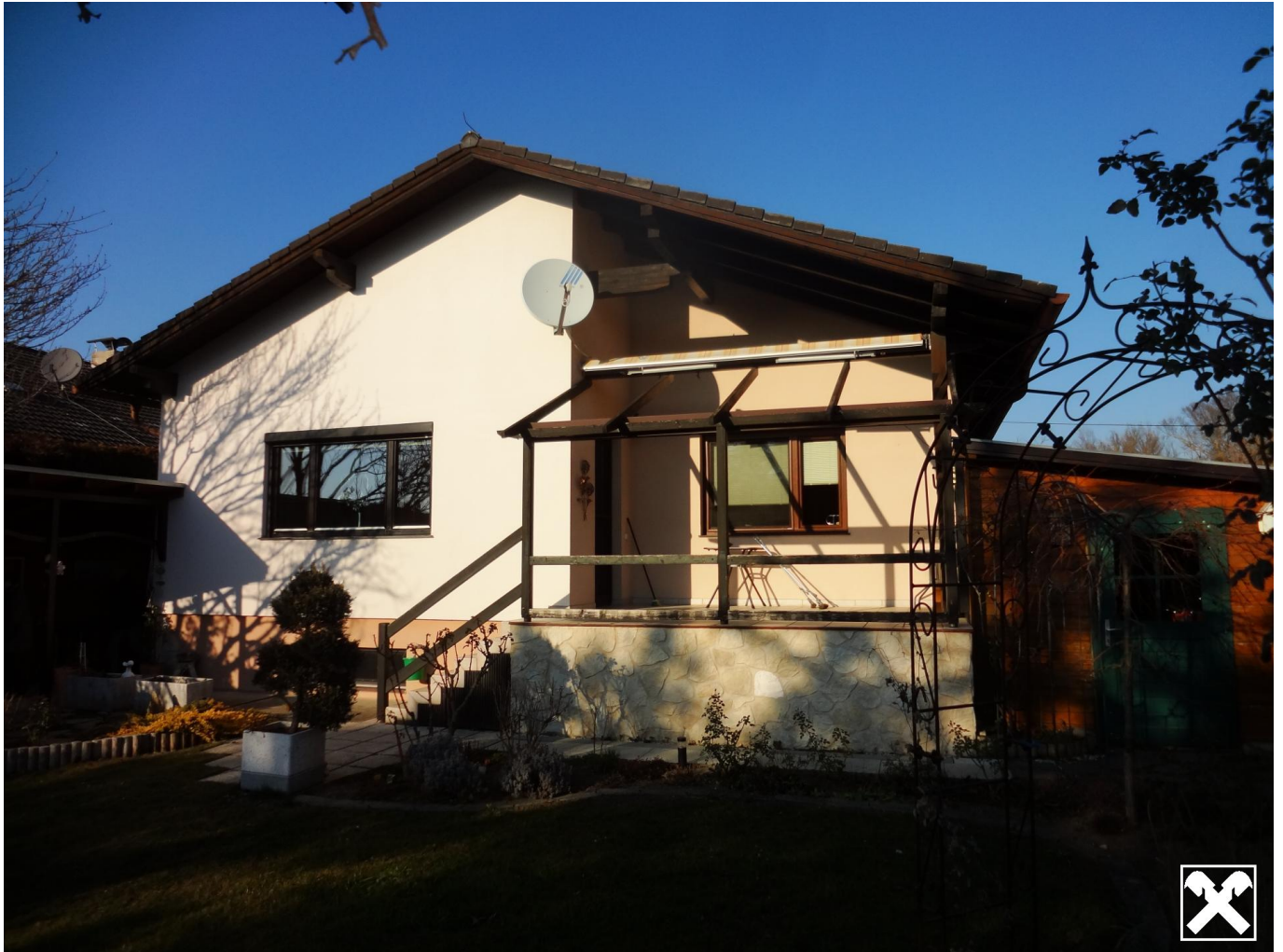
Ansicht vom Garten