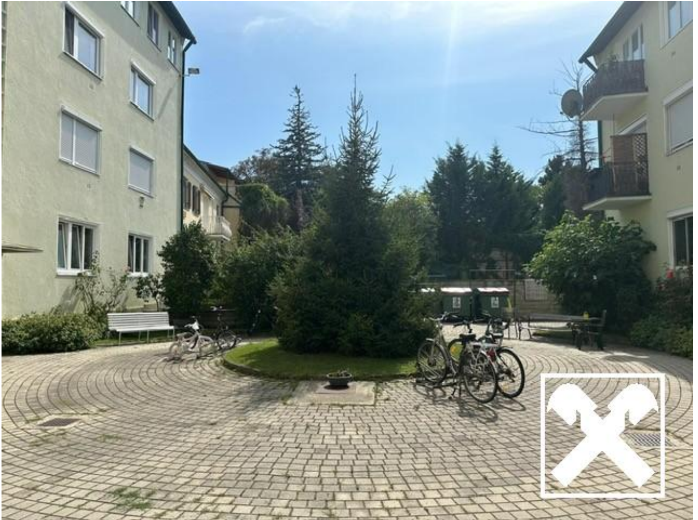
Wohnanlage mit Innenhof