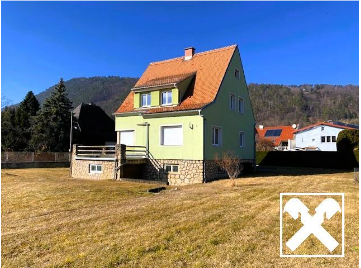
Hausansicht Süd mit Terrasse