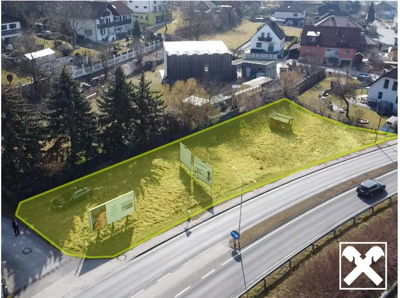
Flugaufnahme - Grundstück farblich hervorgehoben