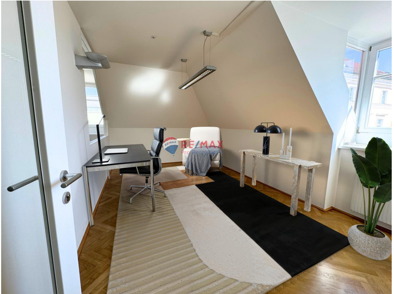
Virtual Staging - Büro