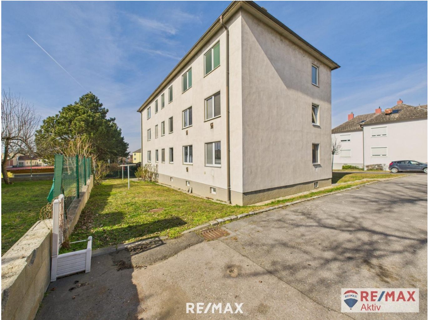
Außenansicht und Gemeinschaftsgarten