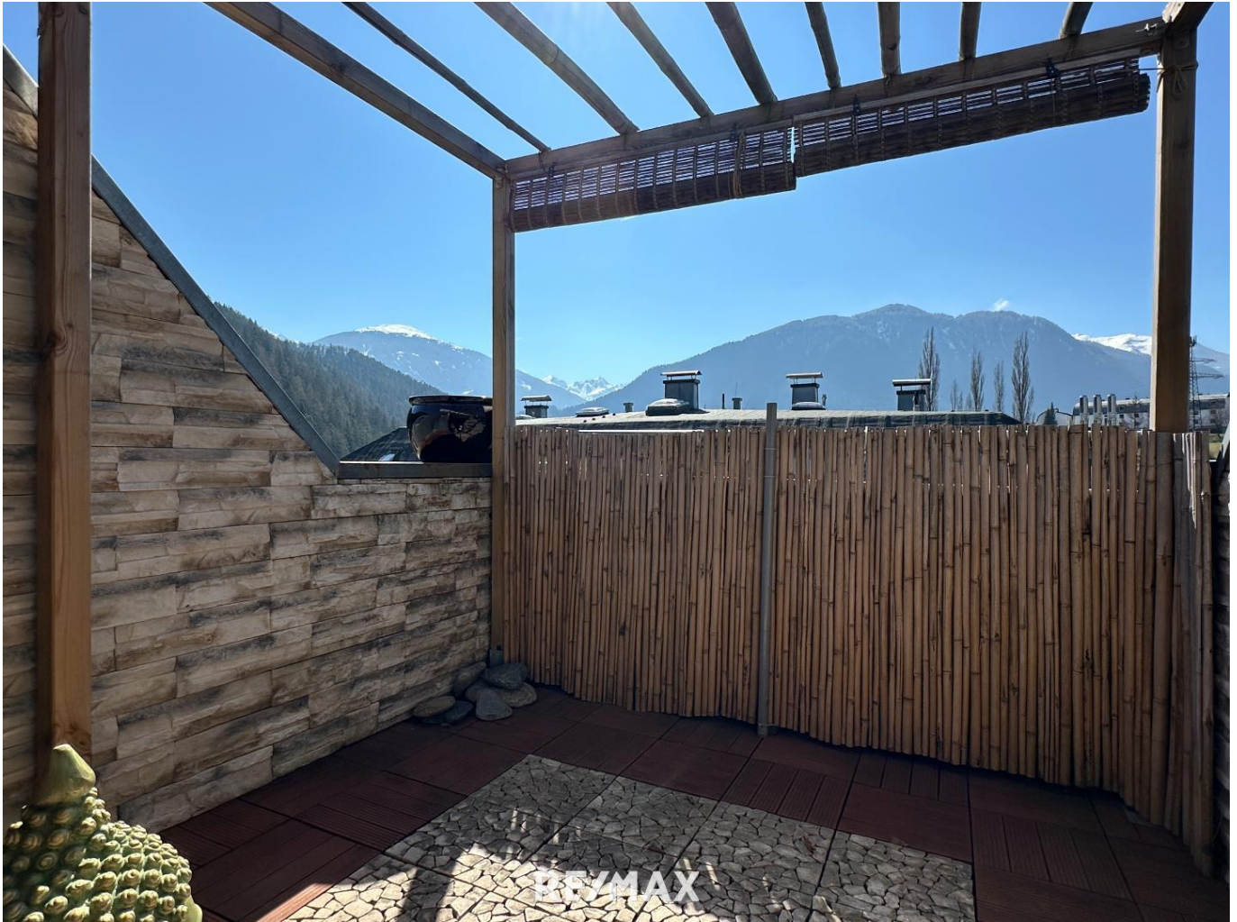
Wohnung - Terrasse