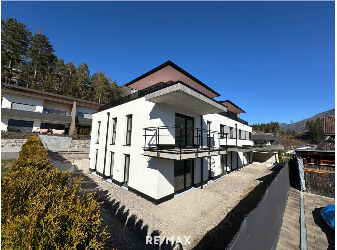
Wohnung - Außenansicht I