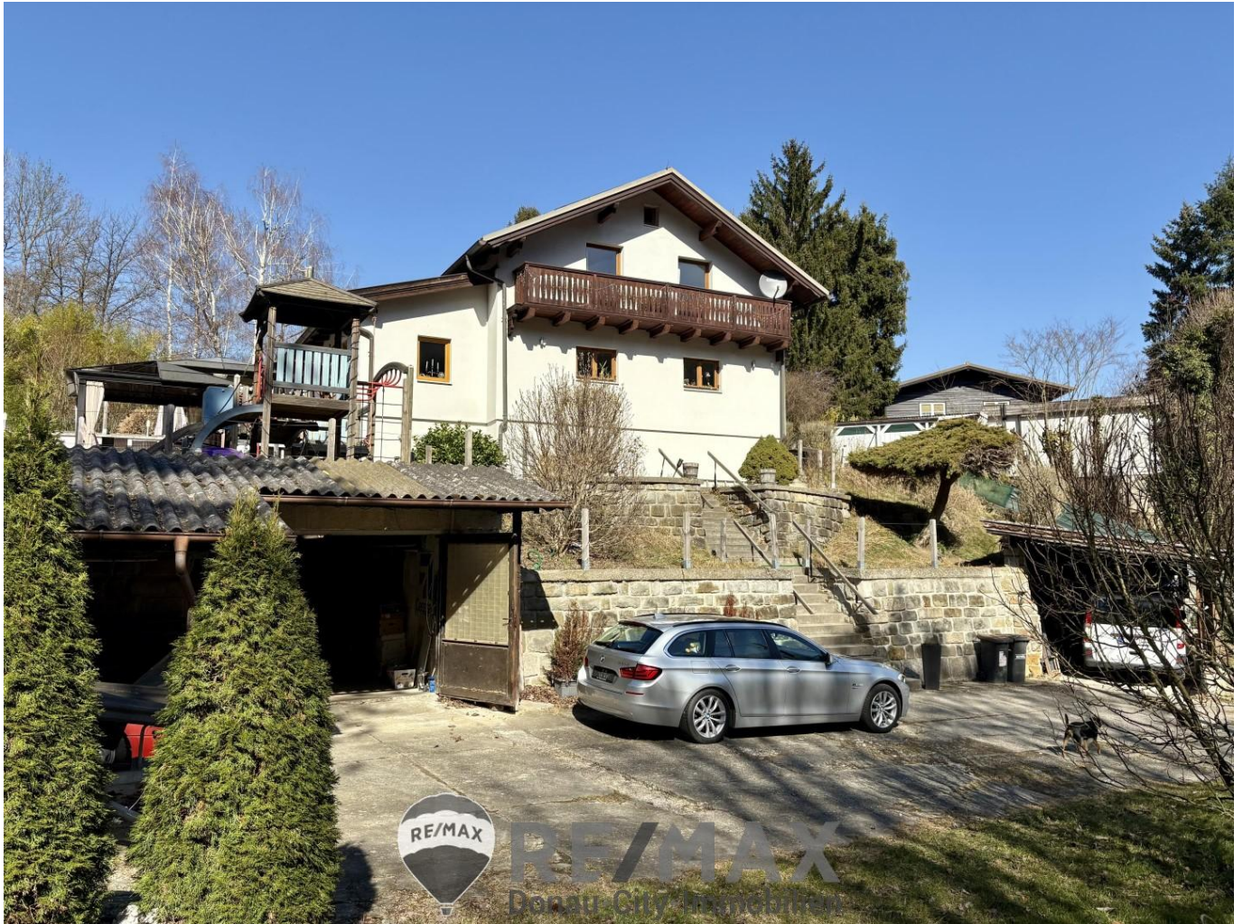
01 Einfamilienhaus in Gablitz