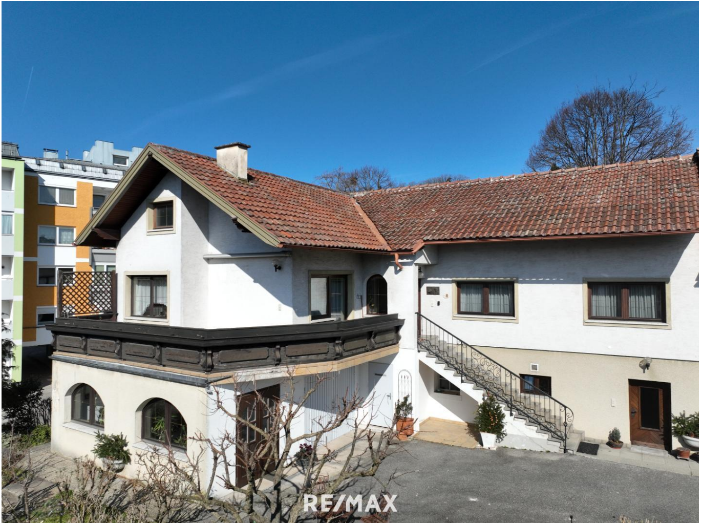
Wohnhaus in zentraler Lage