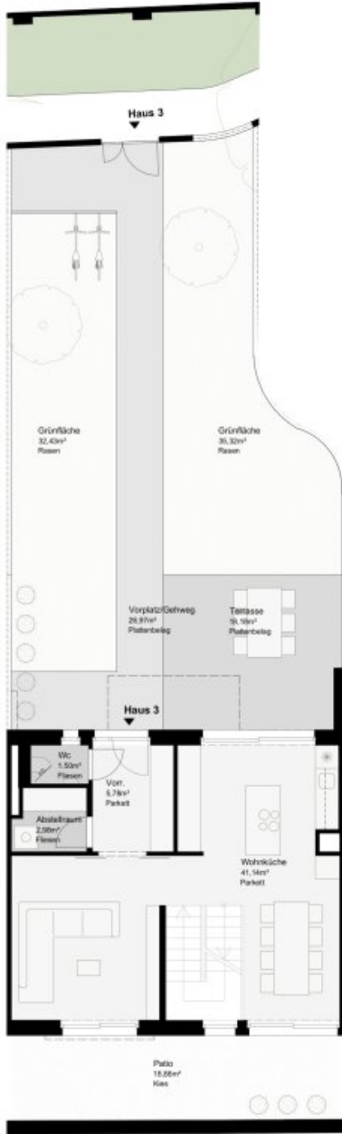
HAUS 3 - ERDGESCHOSS