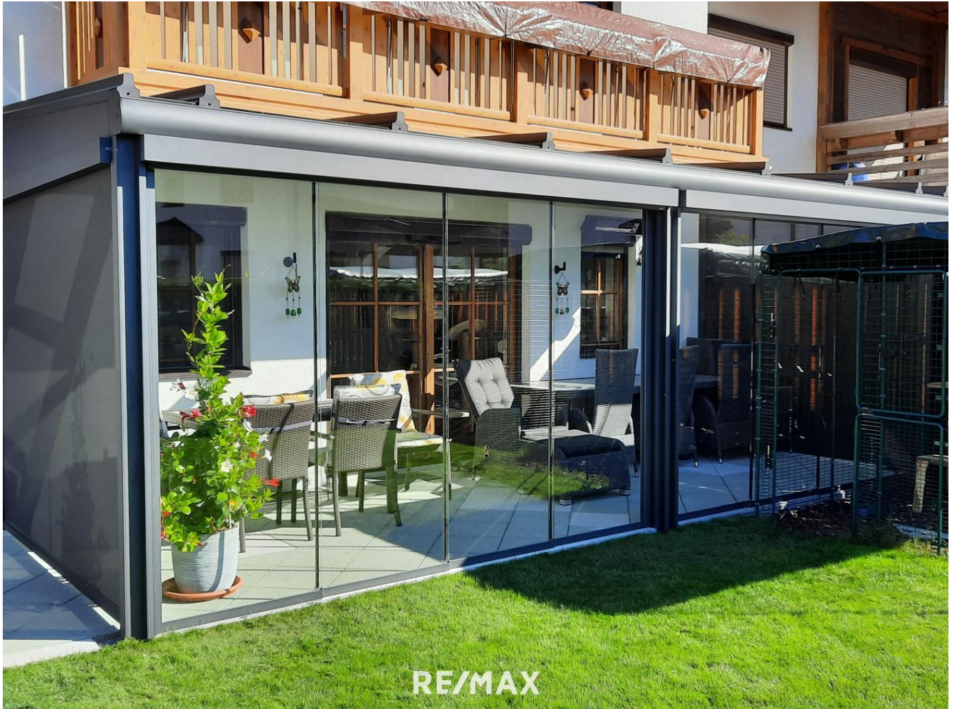
Haus - Wintergarten Außenansicht