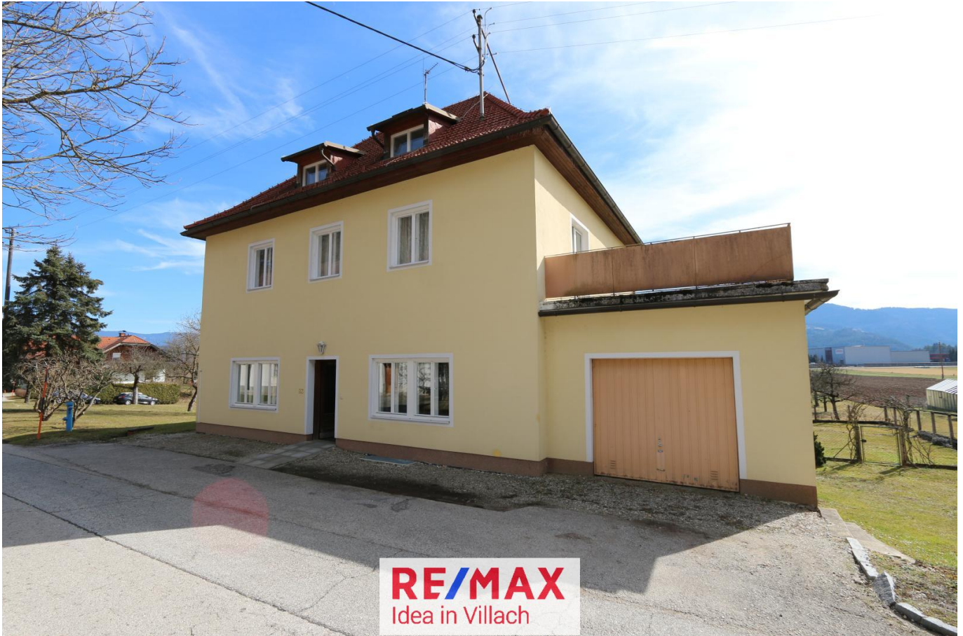
Ansicht Haus 2