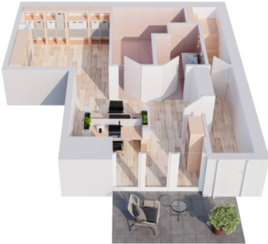
EG 3D Grundriss Büro 2