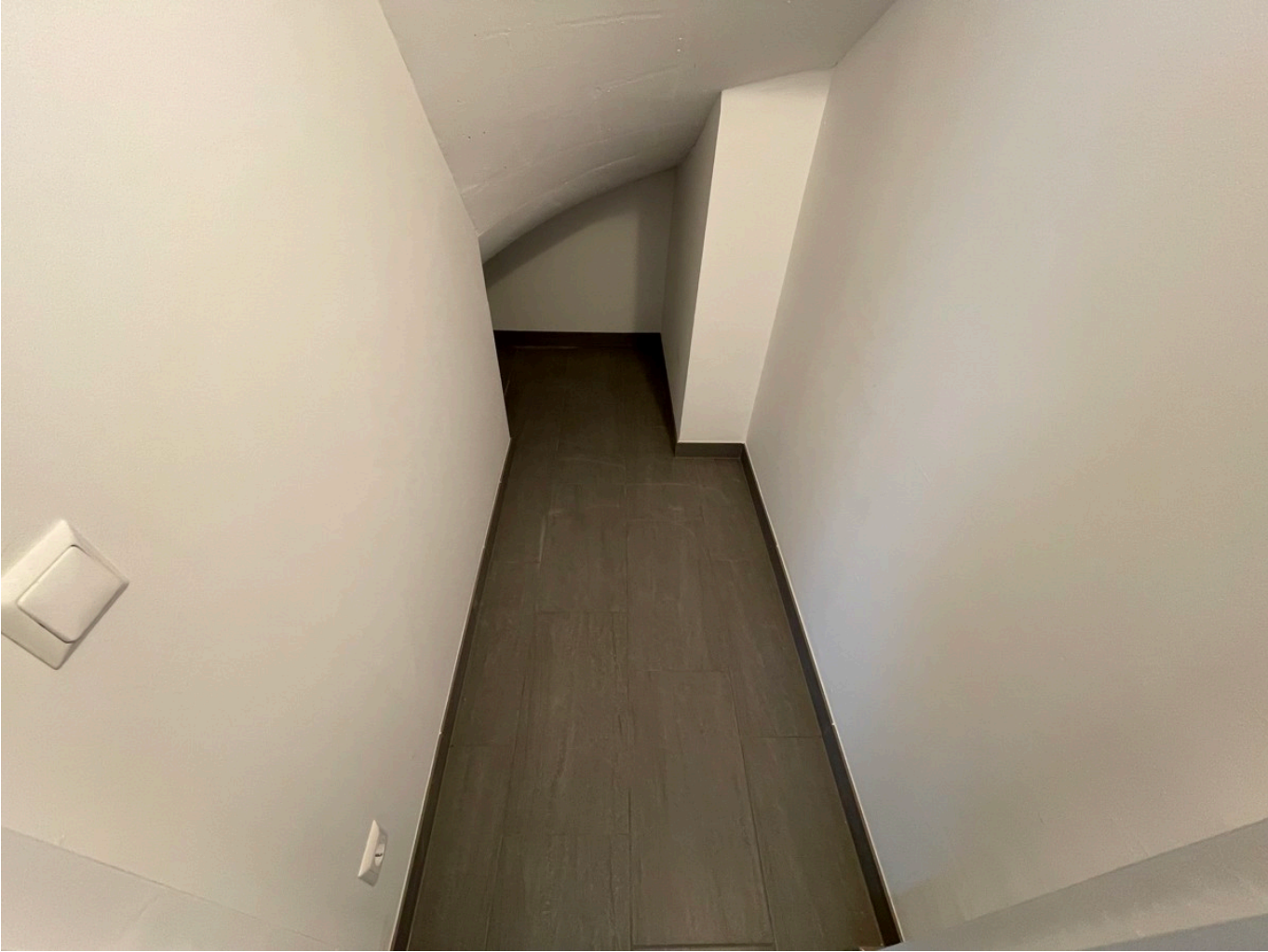
EG Büro 1v2