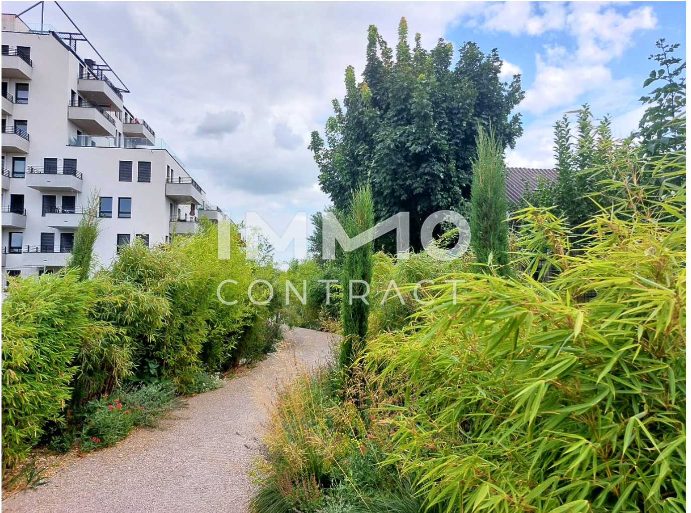
Lax schöner Garten