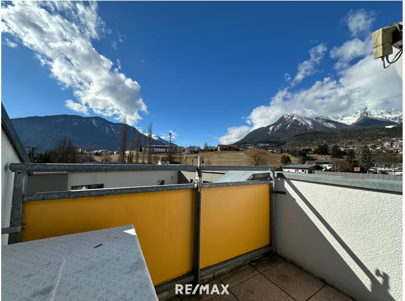
Wohnung - Blick von Balkon