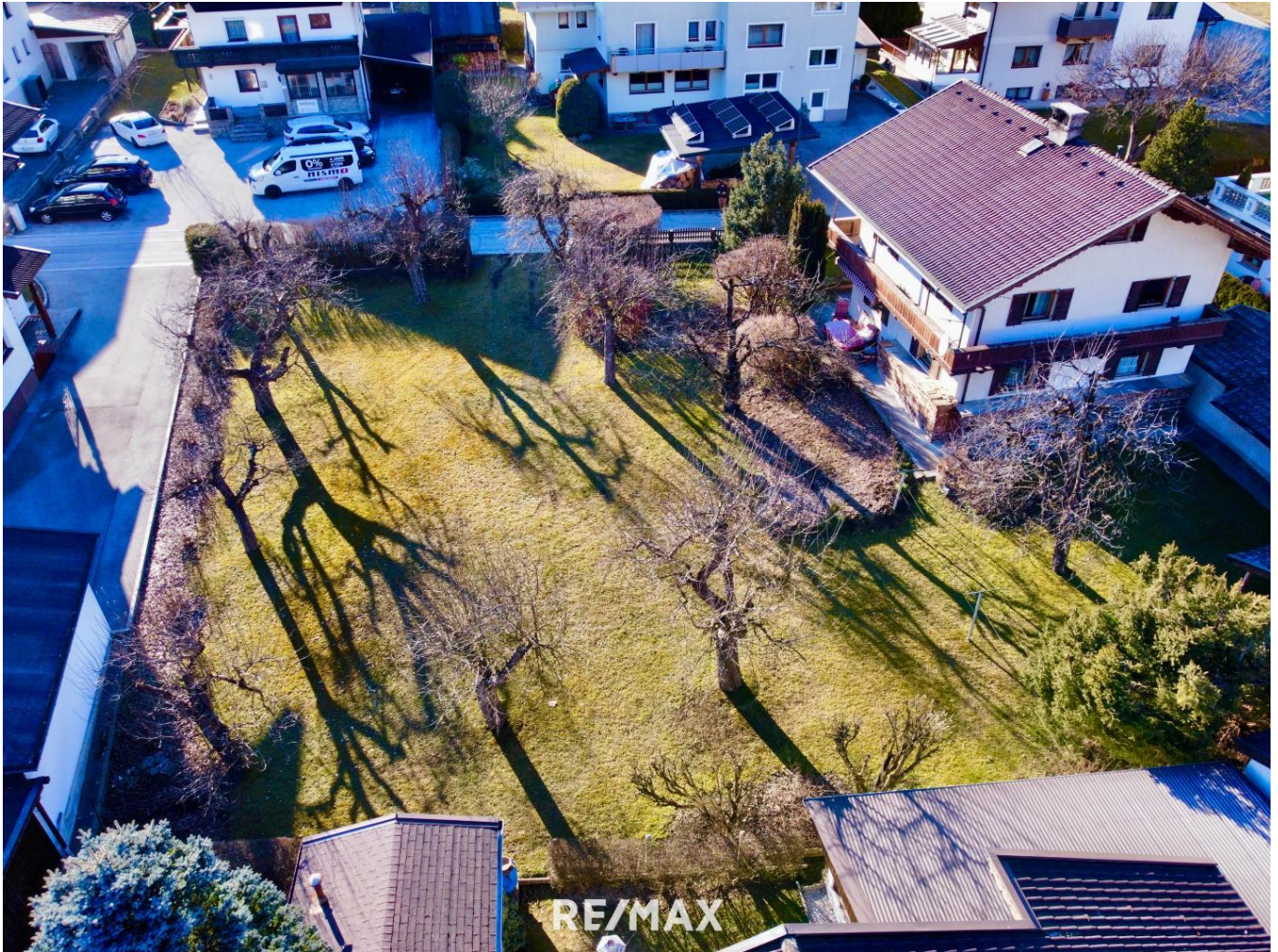
Grundstück Luftbild Ried im Zillertal