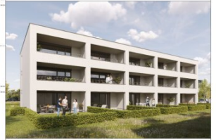
rhetikusstraße 5, altach untergeschoss