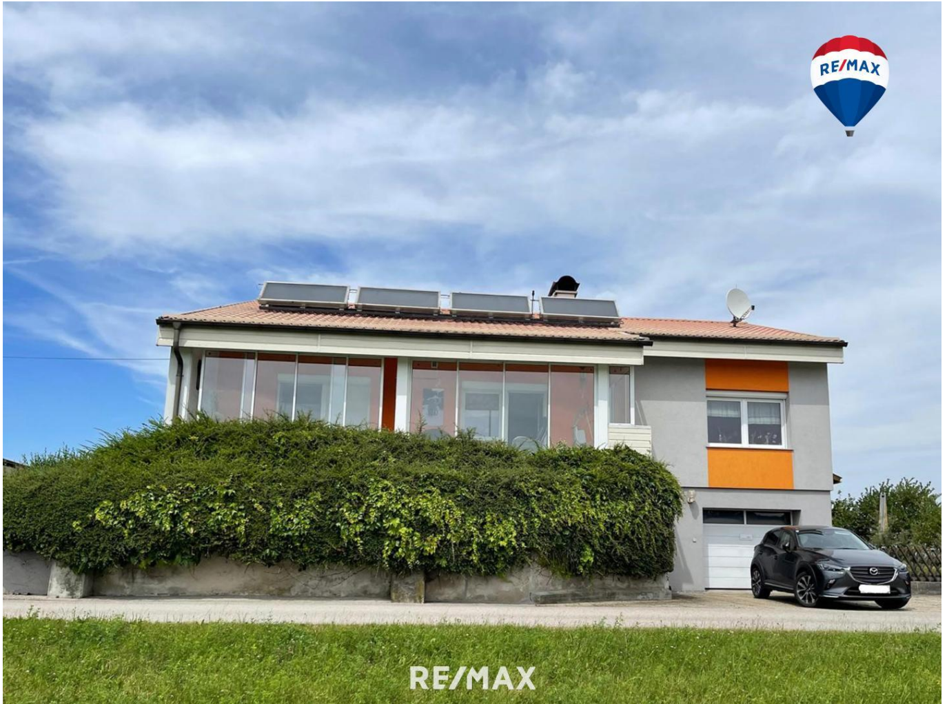
Titelbild Ballon - Südansicht