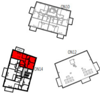
Übersicht 3. Obergeschoss M=1 : 1250