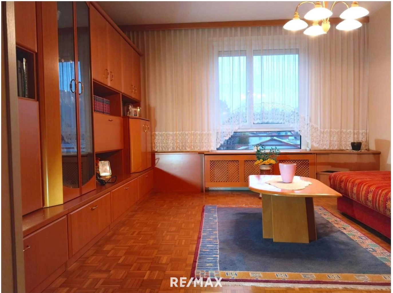
Wohn- Ess Küche