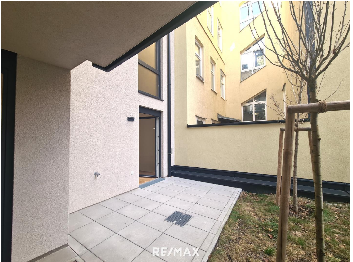
Terrasse mit Bäumen