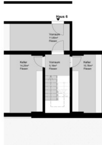
HAUS 6 - KELLERGESCHOSS / TIEFGARAGE