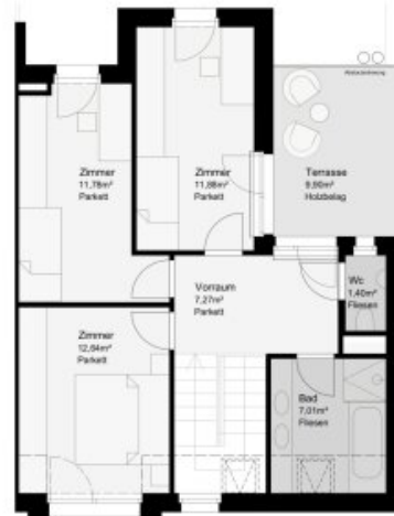
HAUS 6 - DACHGESCHOSS