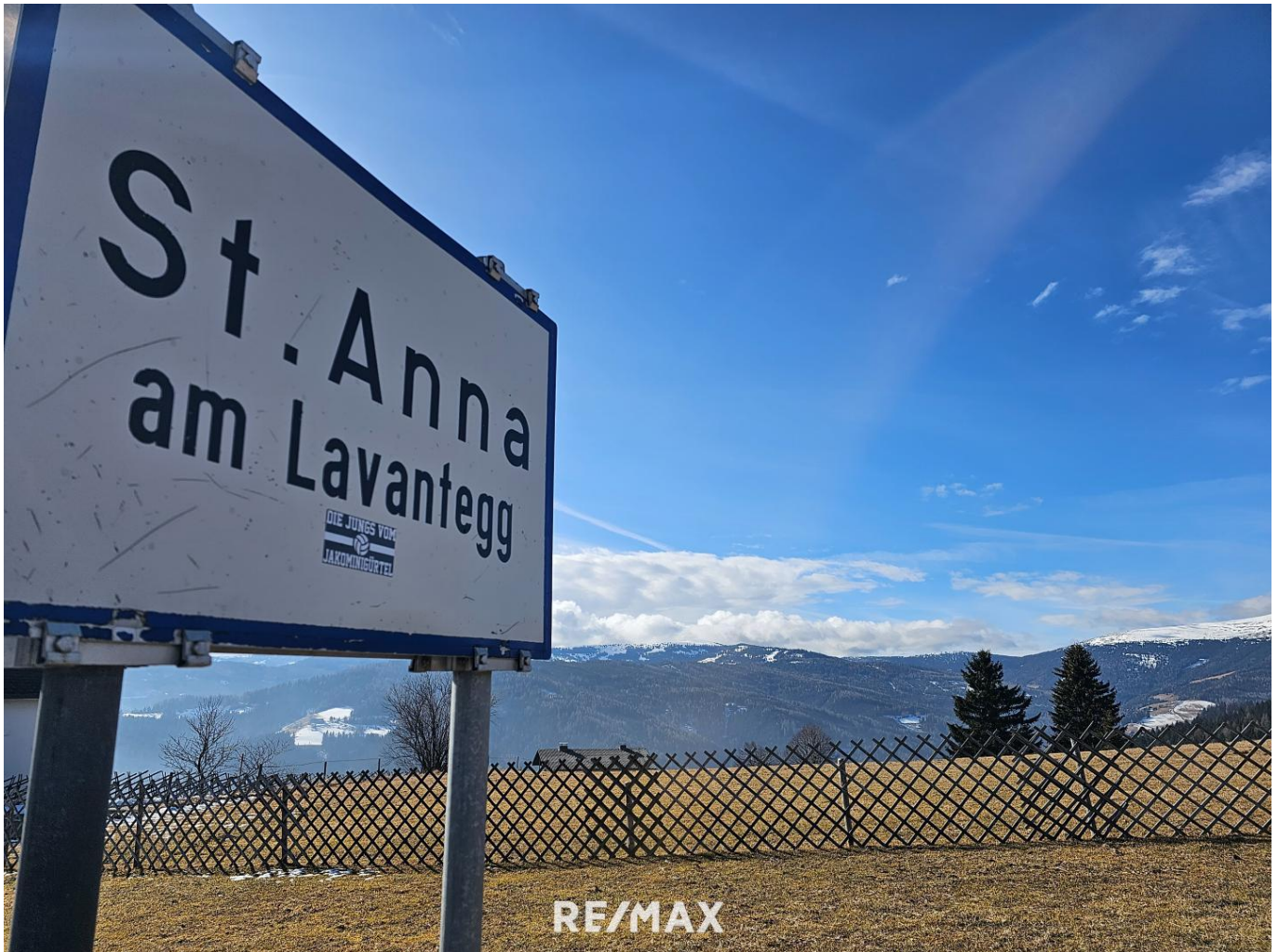
St. Anna am Lavantegg