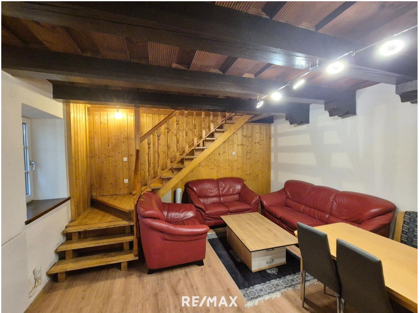
Wohnbereich und Küche_EG