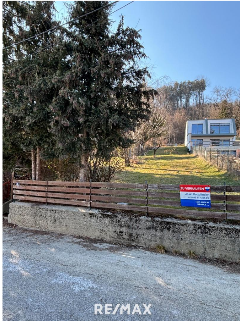
RE/MAX Ansicht Straße