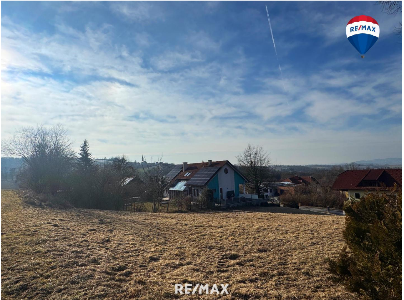
Titelbild Blick Richtung Westen