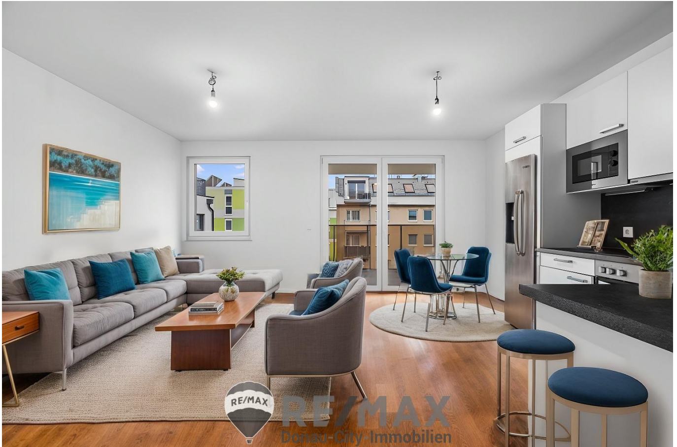
Symbolfoto- Living Room 3