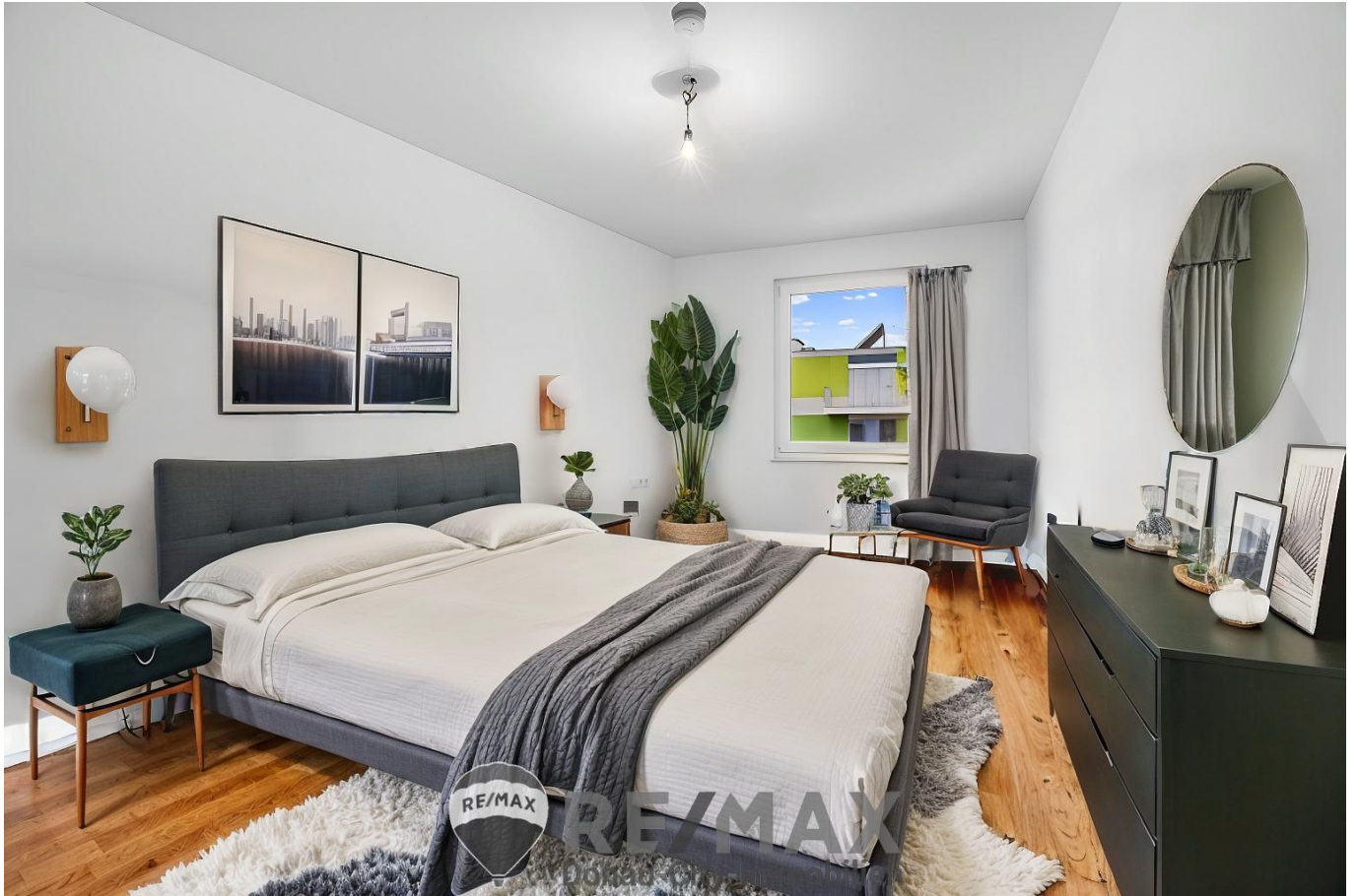
Symbolfoto - Bedroom 3