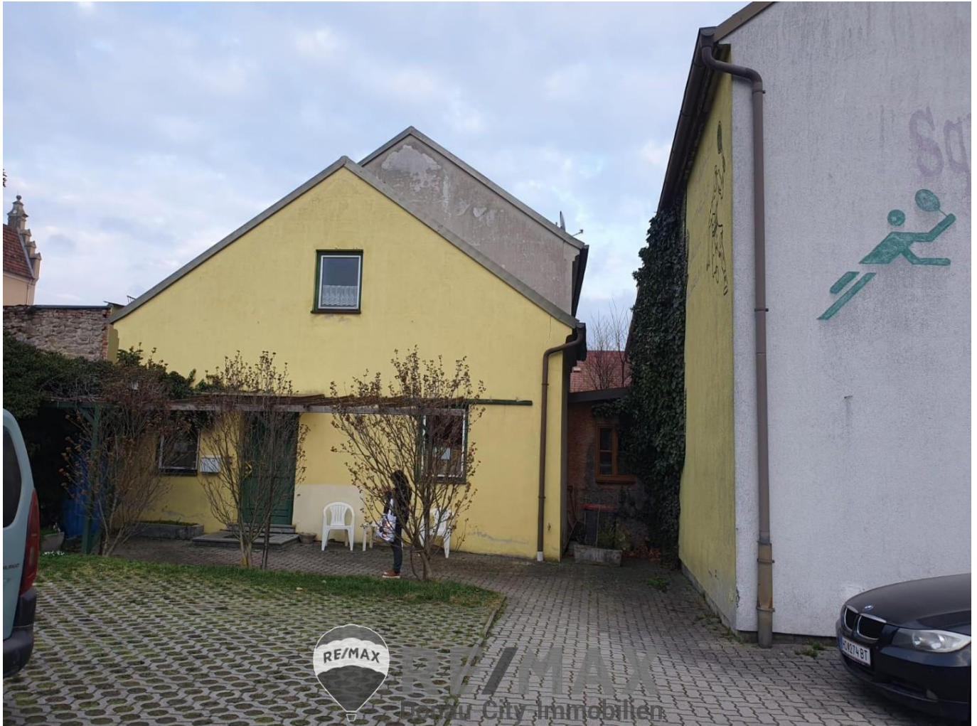
GWO 3580 Horn - Aussenansicht