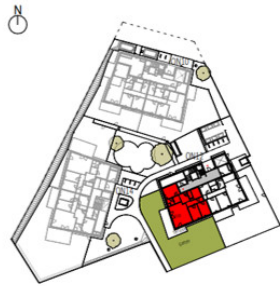
Übersicht Erdgeschoss M=1 : 1250