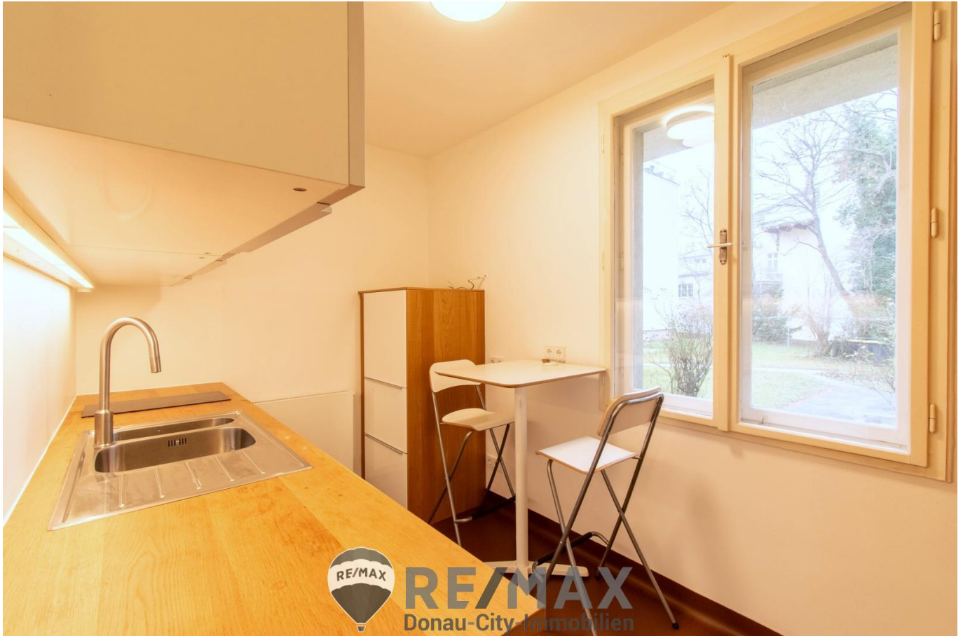
Küche, Ansicht 1