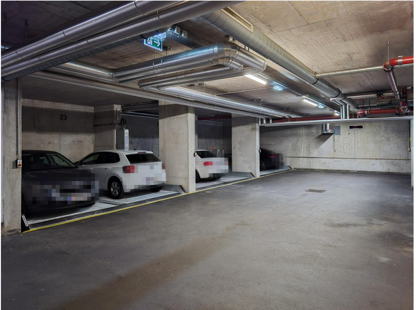
Garage - gepflegte Anlage