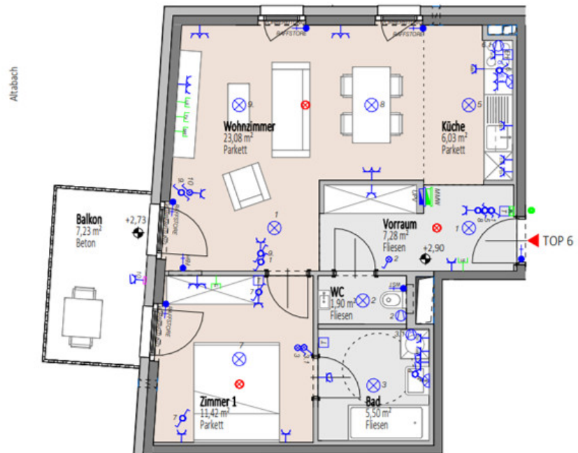
Übersicht 1. Obergeschoss M=1 : 1250