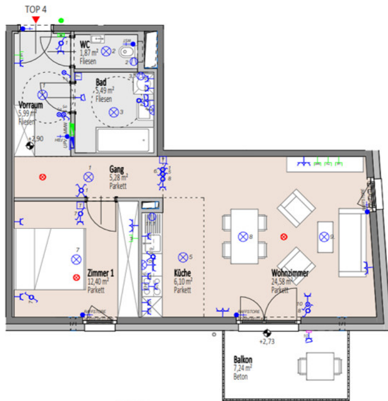
Übersicht 1. Obergeschoss M=1 : 1250