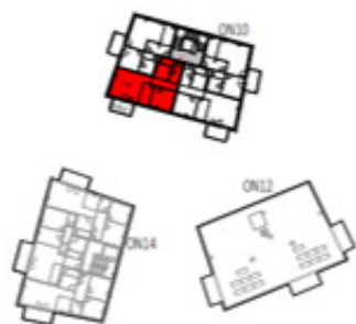
Übersicht 3. Obergeschoss M=1 : 1250