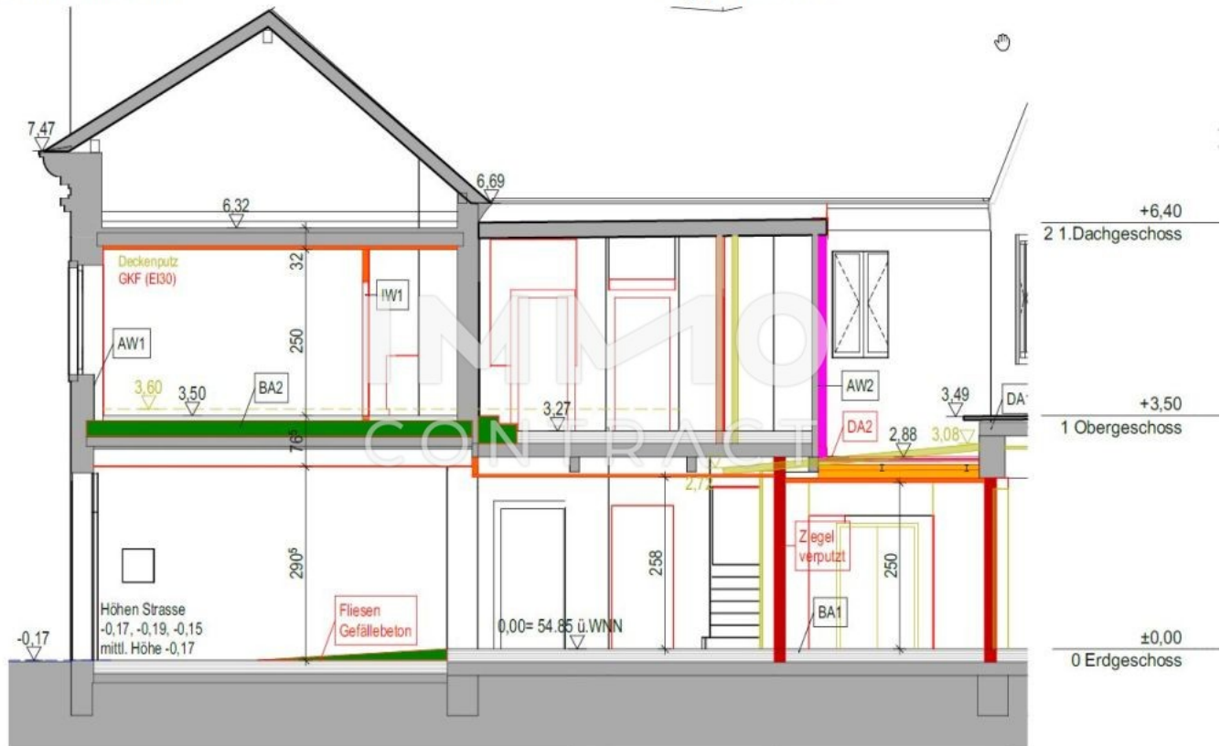
Schnitt S1 M. 1:100