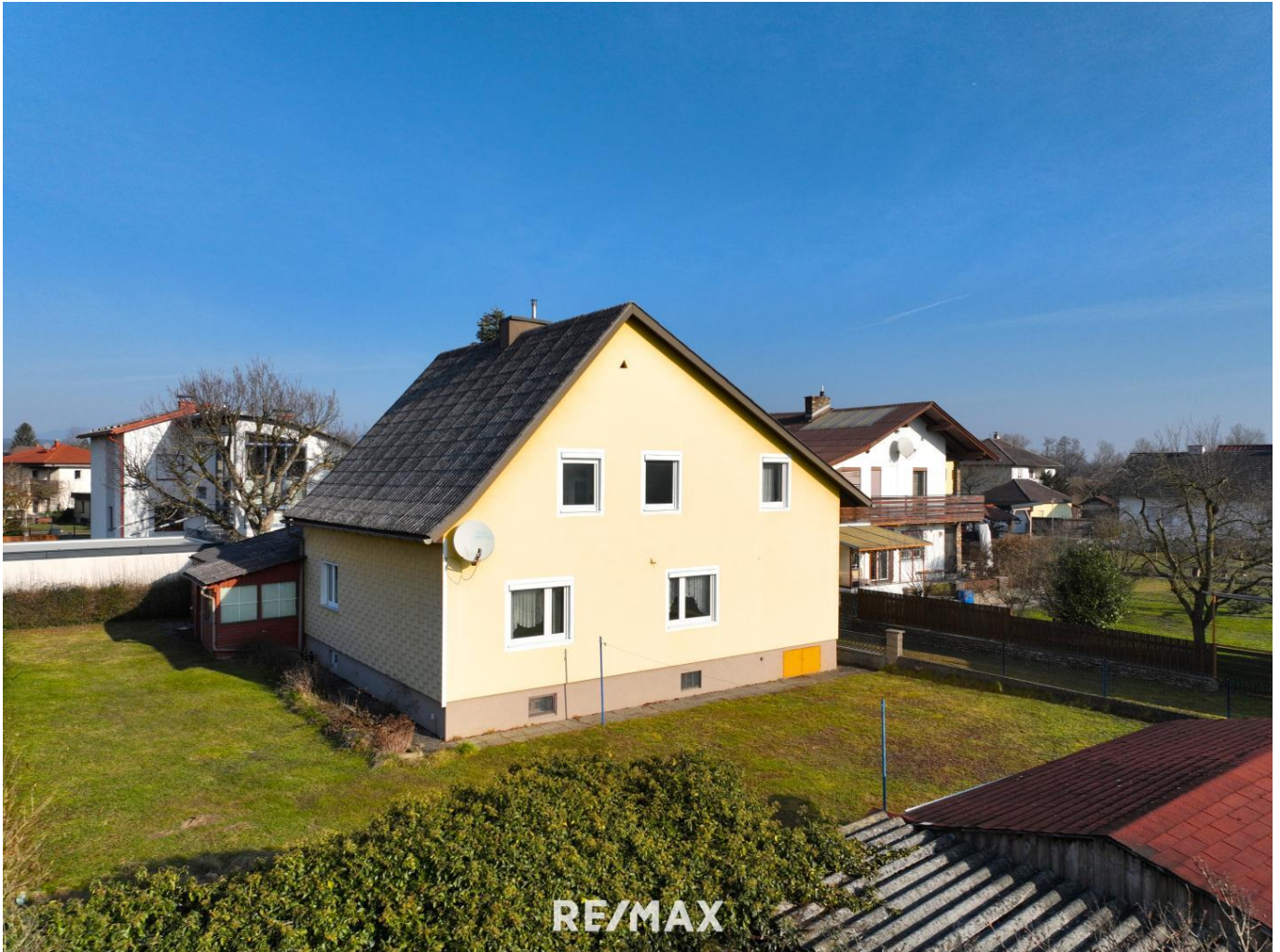
Haus an der Sonnenseite