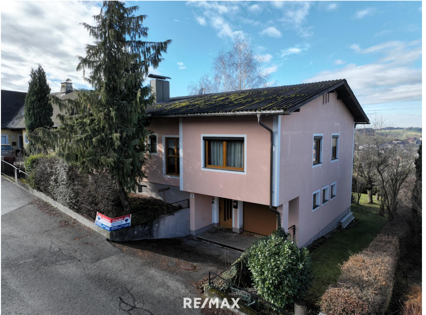
Wohnhaus in Siedlungslage