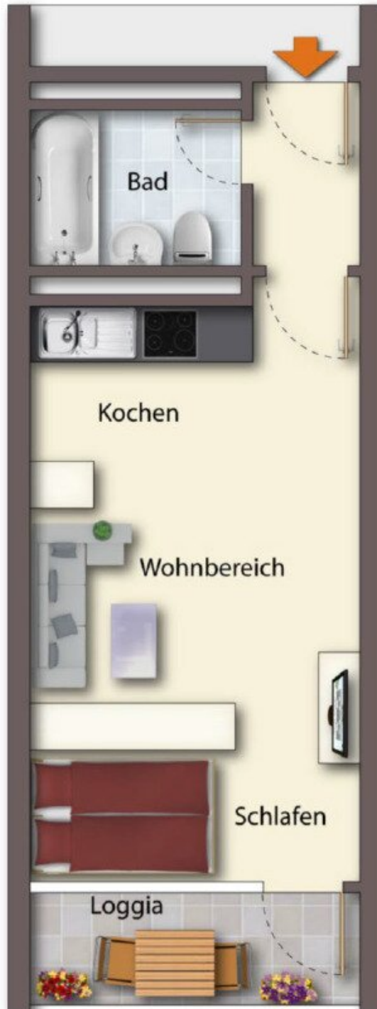
Grundriss möbliert - schematische Darstellung