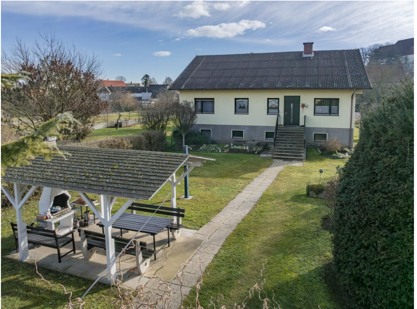
Haus 1 - Vorgarten Pergola