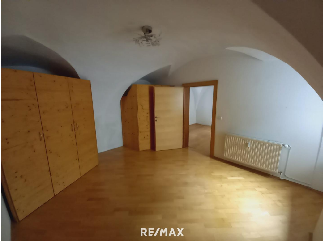
Schlafzimmer Wohnung 2